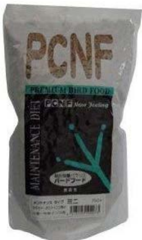
鳥用のご飯と用務員じゃないか(笑)。