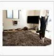
【経絡】お盆☆2014【秘孔】 / ぺんじやみん