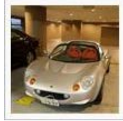
【ハートの】シート、足届い た！【クッ...】 / ぺんじやみん