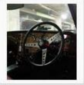
【餌付け】エラン、生きてる か？【29L】 / ぺんじやみん