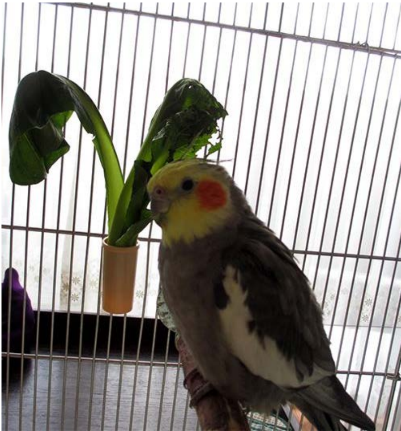
「ズプリーム・ラウディブッシュ・ぺんちゃん」。