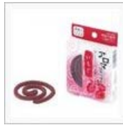
【PANAMA】3か月が過ぎ、 蚊に負け... / ぺんじやみん