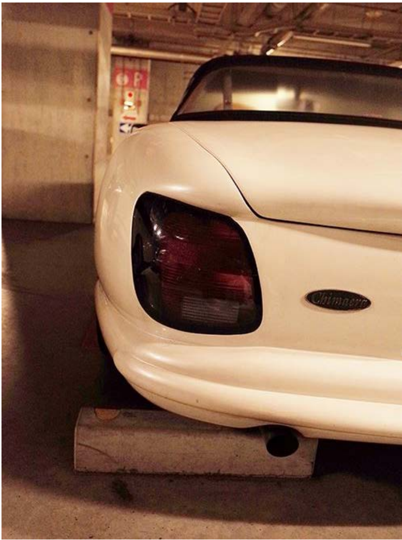
英国車万歳。 英国から、ペンギンカフェ・オーケストラメンバー、プロモ来日中♪