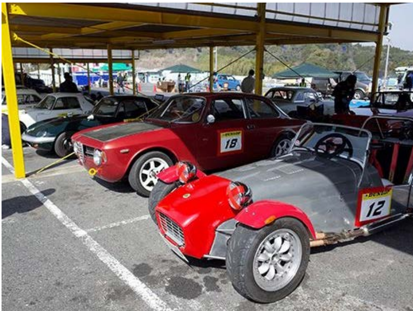
そして有明会でもおなじみのロータスな方々も。