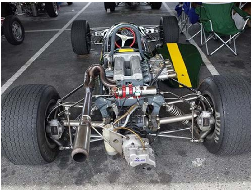
かなりの台数が走行しました。