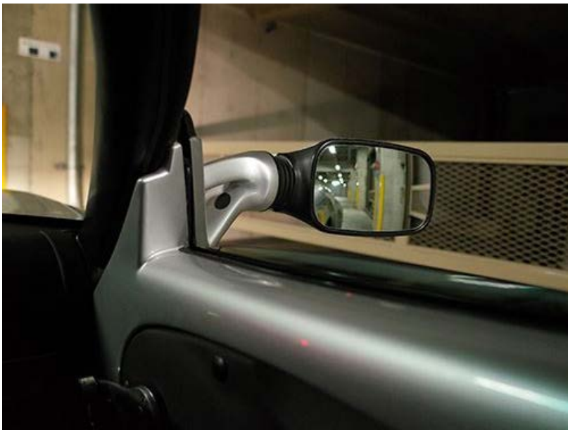
駐車場のストッパーに「ギリ」、5mm余裕なかった～～。