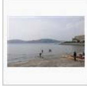
【コン汰の】いざ、試走【空色mini】 / ペンじゃみん