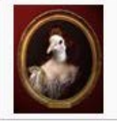
【竹釣り】自給自足への道(うそ)【ア...】 / ペンじゃみん