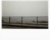
【雷神】雨の葉山【登場】 / ペンじゃみん