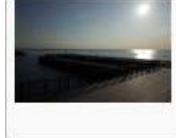
【紙で】脱・ペーパー船長教習【十分】 / ペンじゃみん