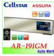
セルスター AR-191GM ミラー型GPSレーダー 探知機 専用OBD2..