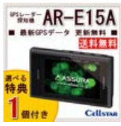
セルスター GPSレー ダー探知機 AR-E15A 選べる特典1個付き