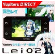
Yupiteru DIRECT 霧島レイモデル Lei02