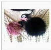
【Austin】 / ぺんじやみん