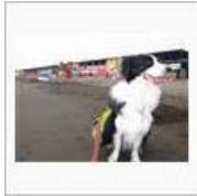
ラティオスと、湘南に、 行ってきまし... / 田中ミノ ル