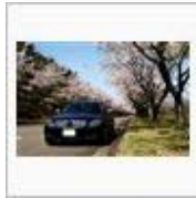
年の瀬、車も大掃除 / ☆ いっちゃん☆