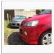
ウァリエッタプロチオフin湘南 / か ず@マイナー車