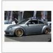
新江ノ島水族館に♪(ε` )/ ヨッシー@TheBeetle