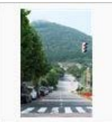
チャーミーグリーンの坂と 思いきや..... / めちゃカワイ