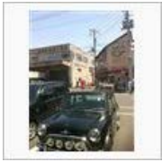
<<【沼津いいとこ】虫地獄沼津紀 ... 【世界が悩む】沼津みなと新鮮 ... >>