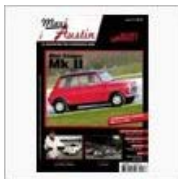
<<【今回のツボは】マガジン来... 【メルベユな国の】嬉しい...>>