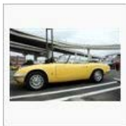
【東海】HCC'95大黒PA【生 麦】 / ペンじゃみん