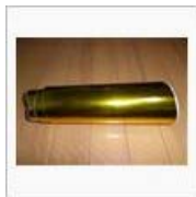
14'コスモの日オフ!! / き みどりFC