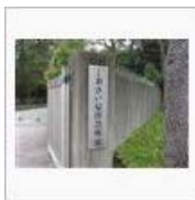
◀◀【サイレント】行って来ました... 【しおさい公園】ミニシブ・...>>