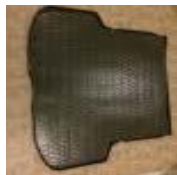
BP レガシイリヤトレー マット