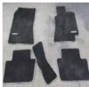
アルテツツァ SXE10 G XE10 レクサス フロア マット