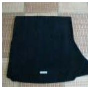
レクサスCT 純正トラン クマット 中古