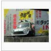
【さらば】沼津基地撤収へ 【クモ部屋】 / ぺんじゃみん