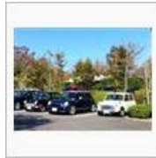
【mini】沼津に行ってきました た【天国】 / ぺんじゃみん