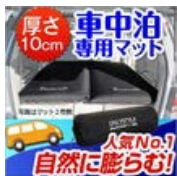
『車中泊必須!』大人気 の『車中泊専用マット』 (車泊・車中泊..