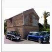
【お隣さん】沼津のmini屋さ ん【コン... / ぺんじゃみん