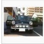
【沼津いいとこ】虫地獄沼津 紀行【一度は... / ぺんじゃみん