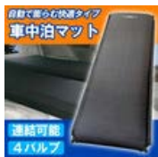
車中泊 マット ベッド 厚さ9cm 自動で空気が入る