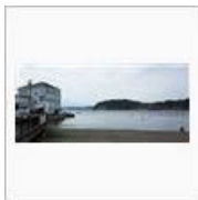
【ハヤク】「秋の予感」で祈願 【キテクレ】 / ペンじゃみん