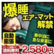
エアーマット エアーマット/車中泊 車内泊 キャンピングマッ..