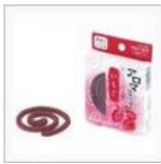
【PANAMA】3か月が過ぎ、 蚊に負け... / ペンじゃみん