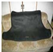
プリウス 30系 ラゲージソフトマット 中古品