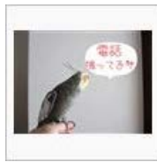
【千切れた】mini☆ご帰還 【ファン】 / ペンじゃみん