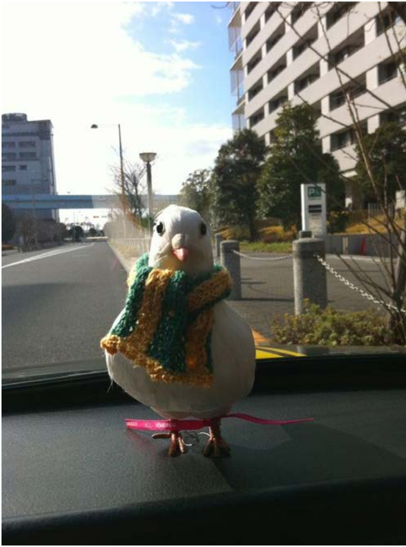
記念写真を撮って疲れたら車内で編み物(笑)。 しろこ達のマフラーを編んだら、自分のも欲しくなっちゃって～。