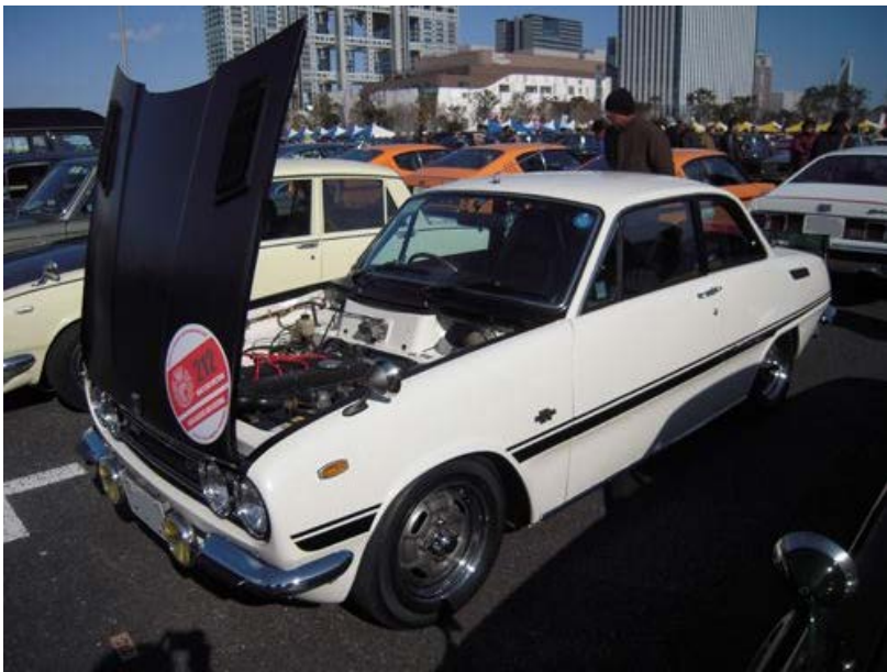
有明会でもおなじみ、ヒュウさんのヨーロッパ。 ヨーロッパ10数台展示されるのも、NYMならではのようです。