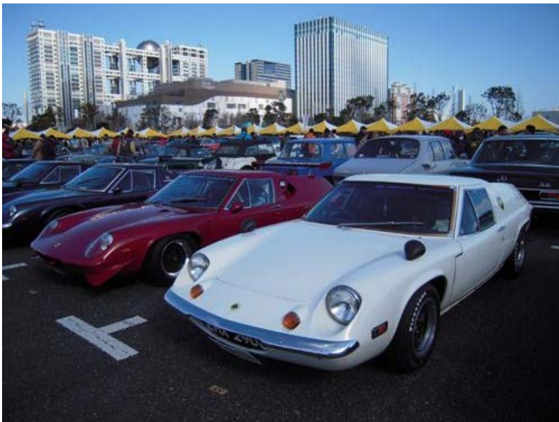
そしてロータス達。これかっこいい、コルティナ。