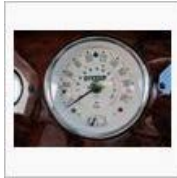
＜＜【手芸班】エラン用ナビのクレ... 記念すべき5万キロ、あと少し...＞＞