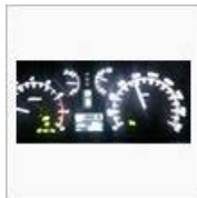
キリ番GET / ゆ〜ぞ〜@G