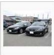
ブログ用130516 / zukko.