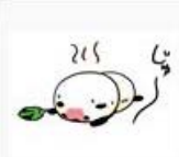
エアコンレス / s30kai