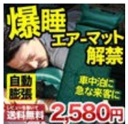
エアーマット エアーマット/車中泊 車内泊 キャンピングマッ..