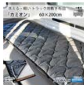
車内泊 車中泊 洗える敷き布団 約60×200cm 布団専門店の中..