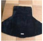
レクサスIS 純正トランクマット 中古