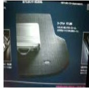
レヴォーグ カーゴマット