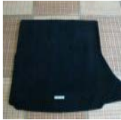
レクサスCT 純正トランクマット 中古