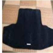
レクサスGS 純正トランクマット 中古