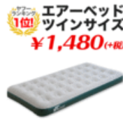
エアーマット ツインサイズ アウトドアベッド マット 車中泊 テ..