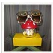
<<【ハカかも】えっ、遠視と近… 【ジュラ】修理に行っただけ…>>