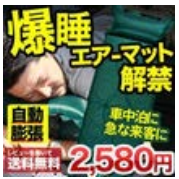
エアーマット エアーマット/車中泊 車内泊 キャンピングマッ..