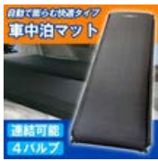
車中泊 マット ベッド 厚さ9cm 自動で空気が入る