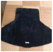
レクサスIS 純正トランク マット 中古