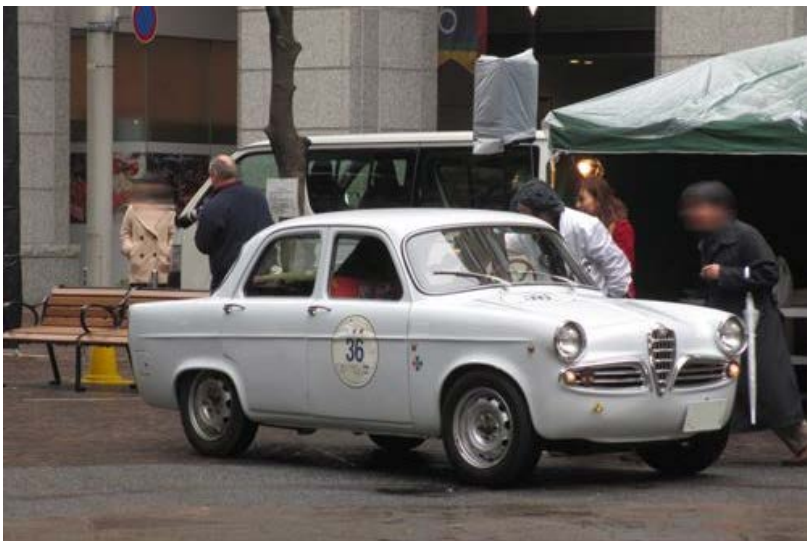
↓ AlfaRomeo Giulietta Berlina

おっと！ コブラの荘厳なエンジン音に群がる人々もちろん私も。 そこにはなんと～。 「うちのminiのオートサン」が～！