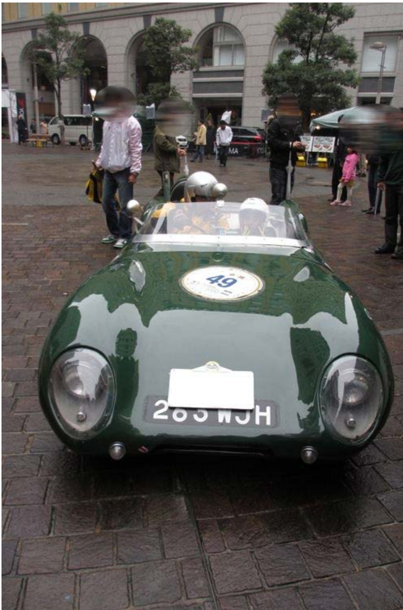
↓ Lotus 7 Sr1 Cothworth