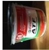
カストロールATF Professional 20L缶 新 品 未開封