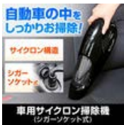
自動車の中を しっかりお掃除！ サイクロン構造 シガー ソケットも 車用サイクロン掃除機 (シガーソケット式)