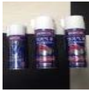
ワコーズ ラスベネ パイ タスドライ 潤滑セット