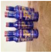
ワコーズプレミアムパ ワー5本！1円から！