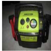
レスキュー950 プース ターパック Rescue 950 レッカー