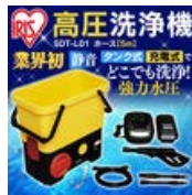
高圧洗浄機 SDT-L01 9-215AG 業界初 静音 超強力 でも洗浄！ 強力水圧