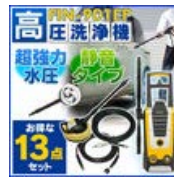
高圧洗浄機 超強力 水圧 13点 セット