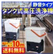
静音タイプ タンク式高圧洗浄機 10m 送料無料