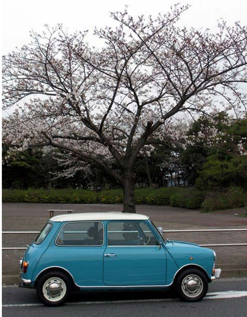
帰り道に出会ったカッコイイ先輩。

しかし、今回は一番桜と似合う色(サーフブルー)にも関わらず あいにくの白い空で残念。また来年頑張りましょう(笑)。