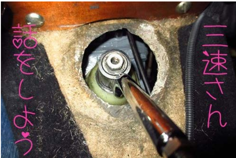
おニューを履かせます。どこまで下げればよいのかわからず、