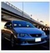
JCTをはしごしてみた。 / siku(ジク)