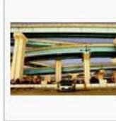
JCTの魅力? / お~さわ