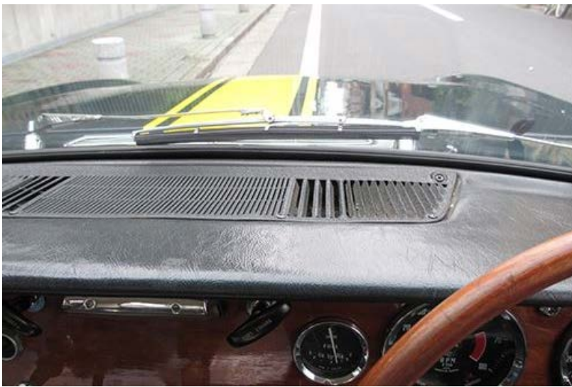
バキュームポット周り大修理で丸目ぱっちり