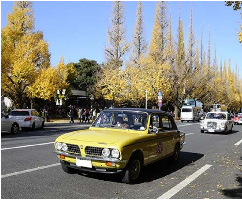
維持されるの大変かと思ひます。しかし本当に素敵でしたよ。 上のスキー板の演出が最高。 サブ99 1971年