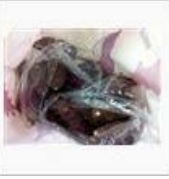
【出発点は】ミカン箱届く！ 【ミカン箱】 / ペンじゃみん