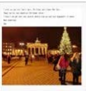
【Glas】ドイツからクリスマス メール... / ペンじゃみん