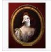
【イテッ】だぶる☆ぱーん ち！！【イ... / ペンじゃみん