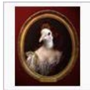
【マー君】2013年ヒット商品番 付【ク... / ペンじゃみん