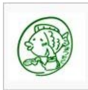
むらさき / タイヤ館松本