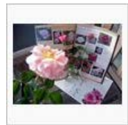
【デビット】バラのお見合い写真【... / ペんじゃみん