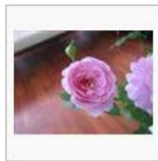
やっばこうじゃなきゃ♪ / ネ申しいずん9