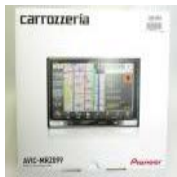
★ AVIC-MRZ099 楽N AVI パイオニア カロツツエリア カーナビ