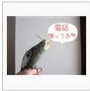
【千切れた】mini☆ご帰還 【ファン】 / ぺんじやみん