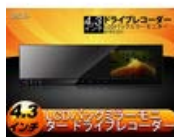
【レビューを書けば送料無料+特価】(L0415)4.3"ルームミラー..