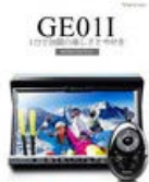
【限定大特価・送料無料】超人気!るぶ観光DATA収録・2X2フル..