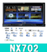
Clarion NX702 フルセグ地デジ内蔵2DIN一体型メモリーナビ