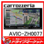
AVIC-ZH0077 7型 フルセグ内蔵HDD サイバーナビ パイオニア カ..