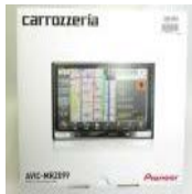
★ AVIC-MRZ099 楽N AVI パイオニア カロツツエリア カーナビ