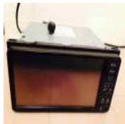
美品 トヨタ純正SDナビ NSZT-W61G地デジ