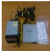
カロツツエリア サイバーナビ AVIC-ZH099G ジャンク