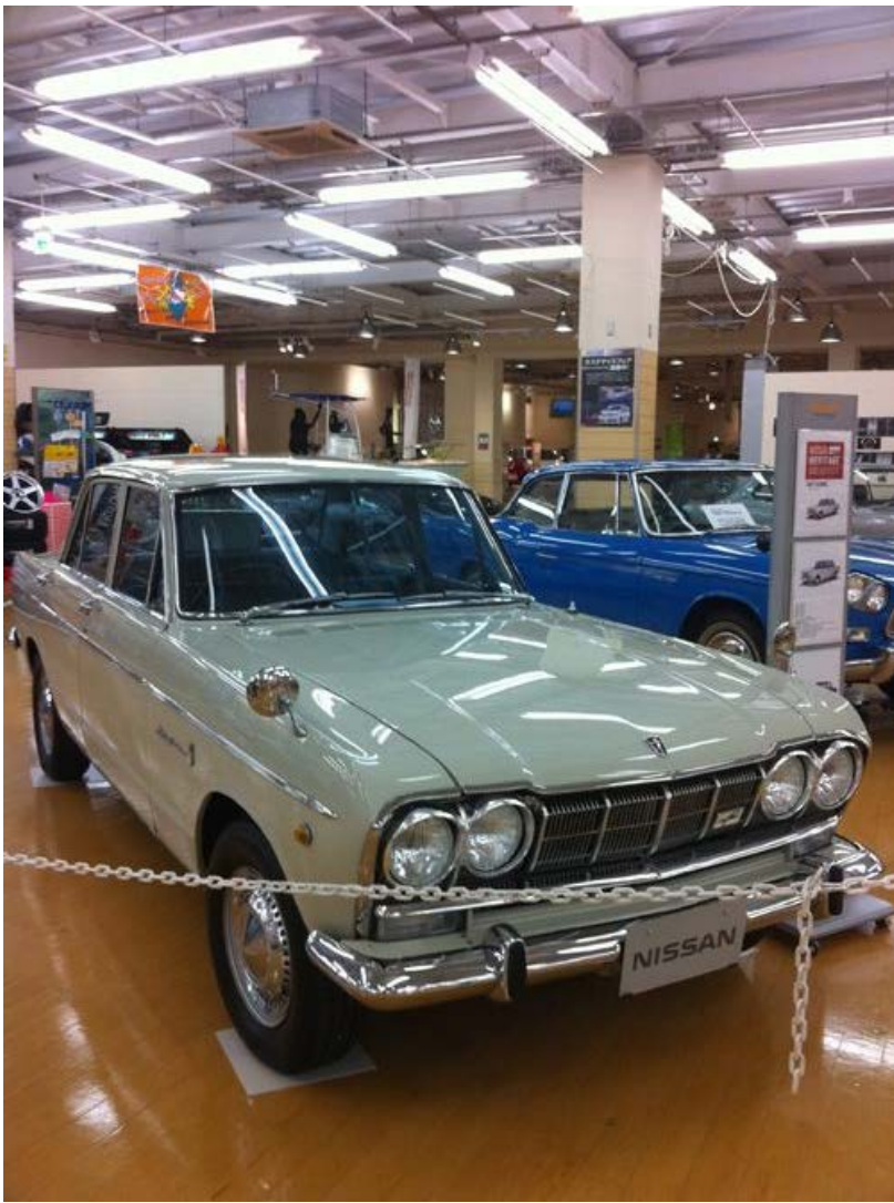
プリンスたんのおしり！