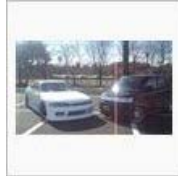
懐かしき時代... / J-ヨシヲ