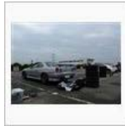
今年初めてのファミ走(TC1000) / まる元