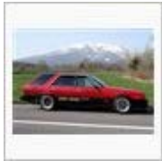
GW前半 / VPJR30改