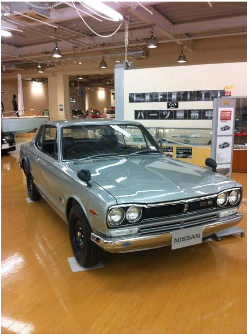
スカイラインがいっぱい！