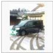
筏釣り / pen-tsuti