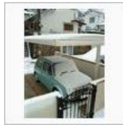
朝から雪・ゆき・ユキ / たけにいちゃん