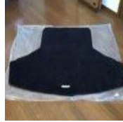
レクサスIS純正トランク マット