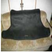
プリウス 30系 ラゲージ ソフトマット 中古品