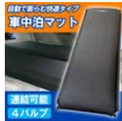
車中泊 マット ベッド 厚 さ9cm 自動で空気が入 る