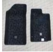
★★★★トヨタ bB 30系NCP30・31・35 フ ロアマット 美品★★★★