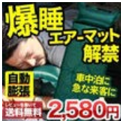
エアーマット エアーマッ ト/車中泊 車内泊 キヤ ンピングマッ..