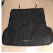
☆150系 ランクルプラ ド 純正マット 美品&激 安スタート☆