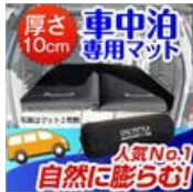
『車中泊必須!』大人気 の『車中泊専用マット』 (車泊・車中泊..