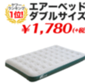
エアベッド エアベッド アウトドアベッド マット 車中泊 だ..