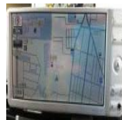
☆中古美品☆トヨタ純正