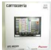
★ AVIC-MRZ099 楽N