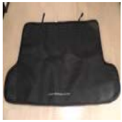
☆150系 ランクルプラ ド 純正マット 美品&激 安スタート☆