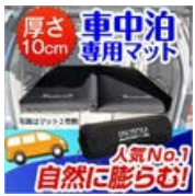
厚さ 10cm 車中泊 専用マット 人気No.1 自然に膨らむ!