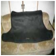
プリウス 30系 ラゲージ ソフトマット 中古品