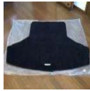
レクサスIS純正トランク マット