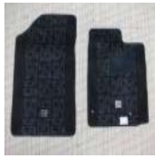
★★★トヨタ bB 30系NCP30・31・35 フ ロアマット 美品★★★