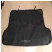
☆150系 ランクルプラ ド 純正マット 美品&激 安スタート☆