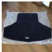
レクサスIS純正トランク マット