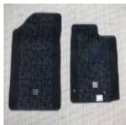
★★★トヨタ bB 30系NCP30・31・35 フ ロアマット 美品★★★