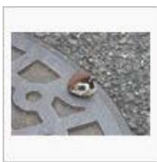
<< 【一足】巢立ち【遅し】 【凄すぎて】有明の風景が変わる... >>

今は角パイプでオラオラ・・・って、嘘です。 つっぱり棒にぶら下がって落ちる程度です。